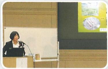
最終選考のプレゼンテーション

第1次、第2次の書類選考を経て、11月22日に行われたプレゼンテーションによる最終選考の結果、最優秀賞には株式会社宝塚すみれ発電様の「再生可能エネルギー