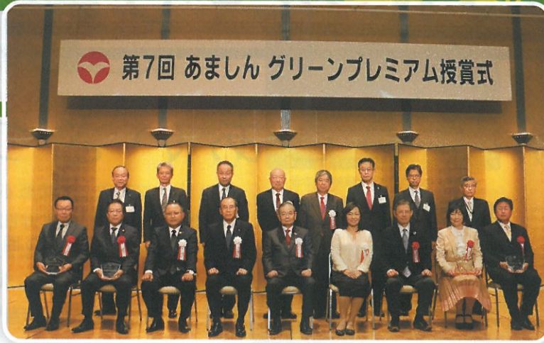
授賞式に臨まれた皆さま

当金庫営業エリア内の法人・個人・団体を対象に環境改善に寄与する技術や製品・工法・取組みやアイデアについて当金庫独自の表彰を行い、積極的に発信していくことで新技術の開発や環境文化の創造につなげていくことを目的としています。