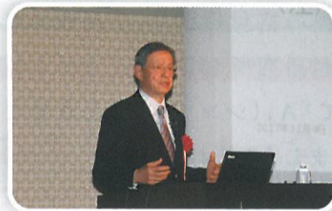
国際金融アナリスト 末吉竹二郎氏の基調講演